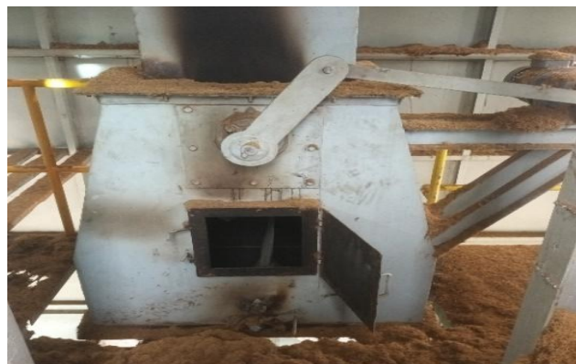
Gambar 8. Pendulum

Pendulum adalah komponen yang berfungsi untuk membagi bahan bakar kedalam ruang dapur Boiler secara merata.