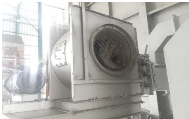
Gambar 4. Blower 1st Forced Draft Fan

Kipas udara pembakaran ( Blower Forced Draft Fan - FD Fan ) pada boiler adalah salah satu komponen penting dalam sistem pembakaran. Kipas ini berfungsi untuk memasok udara (oksigen) ke ruang bakar ( furnace ) agar proses pembakaran bahan bakar dapat berjalan efisien dan optimal.