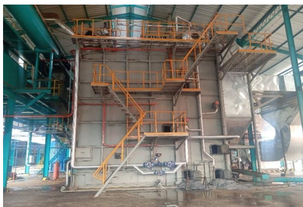
Gambar 2 Boiler Uap

Pompa air umpan adalah komponen yang digerakkan motor listrik yang berfungsi untuk mengisi air kedalam Boiler.