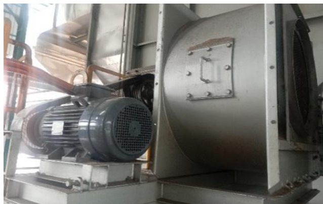
Gambar 5. Blower 2nd Forced Draft Fan

komponen penting dalam sistem pembakaran yang berfungsi menghisap gas buang hasil pembakaran dari dalam Boiler dan mendorong keluar melalui cerobong asap ( Chimney ).