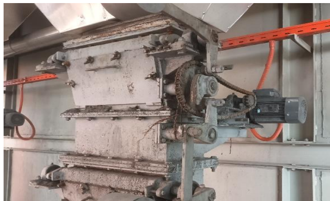
Gambar 7. Double Damper

Double Damper pada boiler adalah komponen pemisah abu dari Hopper pengumpul abu dari udara luar sambil membiarkan abu yang terkumpul keluar dari hopper pengumpul.