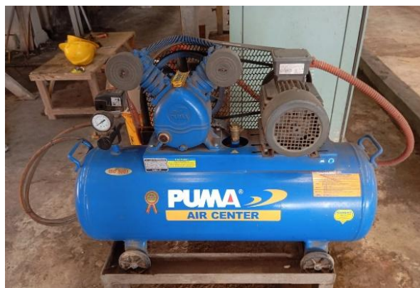
Gambar 10. Kompresor

Kompresor adalah komponen yang berfungsi menghisap udara lingkungan untuk dimampatkan atau meningkatkan tekanan udara, yang dimana udara tersebut digunakan untuk keperluan Aktuator system Kontrol peralatan Boiler.