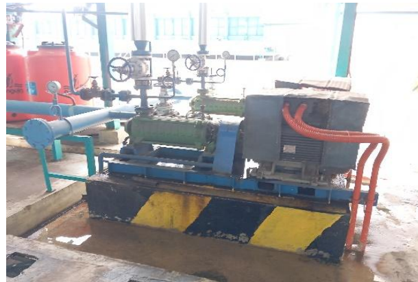
Gambar 3. Pompa Air Umpan pada Boiler

Kipas udara pembakaran ( Blower Forced Draft Fan - FD Fan ) pada boiler adalah salah satu komponen penting dalam sistem pembakaran. Kipas ini berfungsi untuk memasok udara (oksigen) ke ruang bakar ( furnace ) agar proses pembakaran bahan bakar dapat berjalan efisien dan optimal.