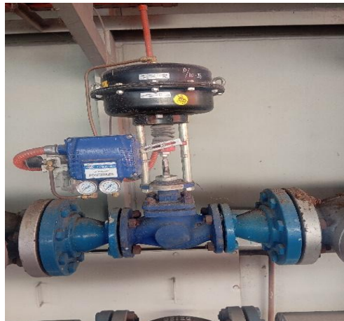
Gambar 12. Aktuator Valve

terlalu tinggi (menghindari carryover ). Menggunakan sensor level dan kontroler serta aktuator valve .