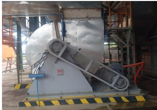
Gambar 6 Blower Induced Draft Fan

Double Damper pada boiler adalah komponen pemisah abu dari Hopper pengumpul abu dari udara luar sambil membiarkan abu yang terkumpul keluar dari hopper pengumpul.