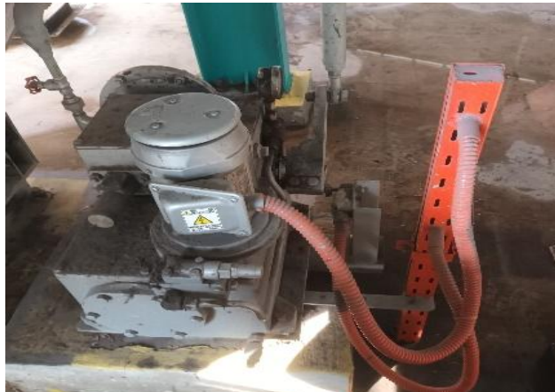
Gambar 9. Draft Control

Draft Control adalah komponen yang berfungsi untuk mengatur aliran udara didalam Boiler sehingga proses pembakaran dapat berjalan optimal dan efisien.