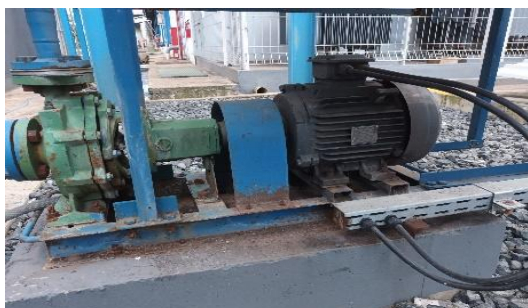
Gambar 11. Pompa Sirkulasi untuk Frame Penahan Castable

Pompa Sirkulasi untuk Frame Penahan Castable adalah Komponen yang berfungsi mengalirkan air dingin ke Frame Water Cooling agar Frame tersebut tidak mengalami panas berlebih yang dapat menyebabkan kerusakan.