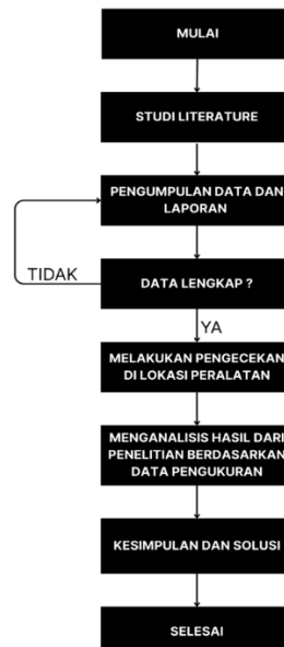
Gambar 1 Diagram alur penelitian

Diagram alur metodologi yang dilaksanakan dalam menyelesaikan permasalahan untuk penelitian ini sebagai berikut pada Gambar 1.