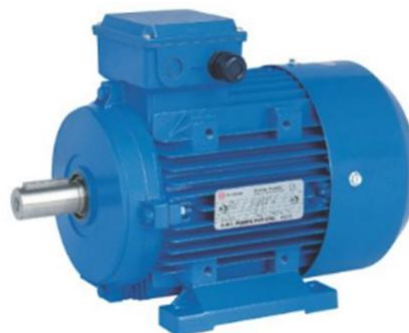
Gambar 3. Bentuk Fisik Motor AC Induksi

Motor AC ada 2 macam yaitu motor AC sinkron dan motor AC induksi. Kelebihan motor AC memiliki fleksibilitas dalam pengendalian kecepatan dan efisiensi yang tinggi yang terdiri dari 2 bagian utama yaitu stator dan rotor [12].