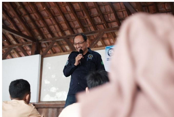
Gambar 1. Proses penyuluhan dan tanya jawab sumber energi terbarukan oleh tim pengabdian

Metode yang digunakan dalam pengabdian edukasi sumber energi terbarukan ini adalah metode ceramah/ penyuluhan dan metode praktik. Metode ceramah dilakukan untuk memberikan gambaran mengenai jenis-jenis sumber energi terbarukan dan bagaimana cara kerja dari setiap sumber energi terbarukan sehingga menghasilkan listrik. Pada metode ceramah juga diberikan contoh-contoh sumber energi terbarukan yang sudah ada dan berjalan mensuplai listrik khususnya di daerah garut, seperti pembangkit listrik tenaga panas bumi (PLTP) di kamojang garut, pembangkit listrik tenaga mikrohidro (PLTMH) cirompang garut, pembangkit listrik tenaga surya (PLTS) yang salah satunya berada di pondok pesantren al wasilah garut, dan pembangkit listrik tenaga bayu (PLTB) yang sedang dikembangkan di daerah pamengpeuk garut. Pada proses penyuluhan/ceramah juga diberitahukan mengenai mobil mainan yang akan dirakit adalah mobil mainan dengan tenaga surya, yang kemudian dijelaskan mengenai cara kerja bagaimana mobil tersebut nanti akan dapat bergerak sendiri dengan menggunakan tenaga matahari, dan gambaran bagaimana proses perangkaian mobil mainan tersebut.