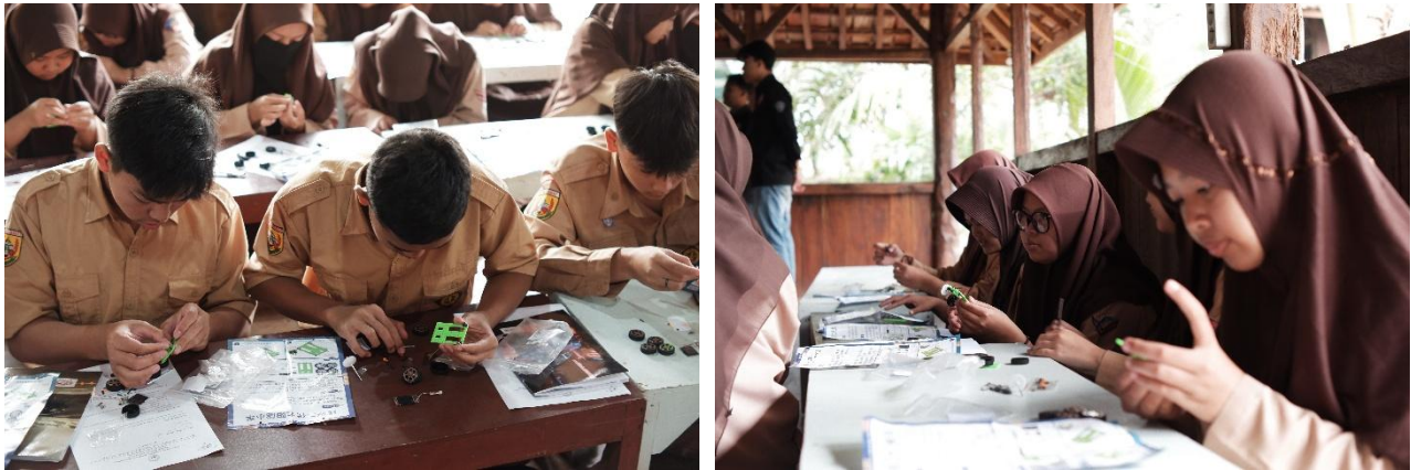
Gambar 2. Proses perakitan mobil mainan bertenaga surya oleh siswa

bertenaga surya. Perakitan mobil mainan dimulai dari perakitan bagian bawah mobil seperti ban mobil, kemudian lanjut ke bagian badan mobil, dan terakhir adalah ke bagian solar panel mobil. Setiap siswa diberikan satu mobil mainan untuk dirakit dan kemudian diujicobakan apakah mobil yang dirakit dapat berjalan dengan baik atau tidak.