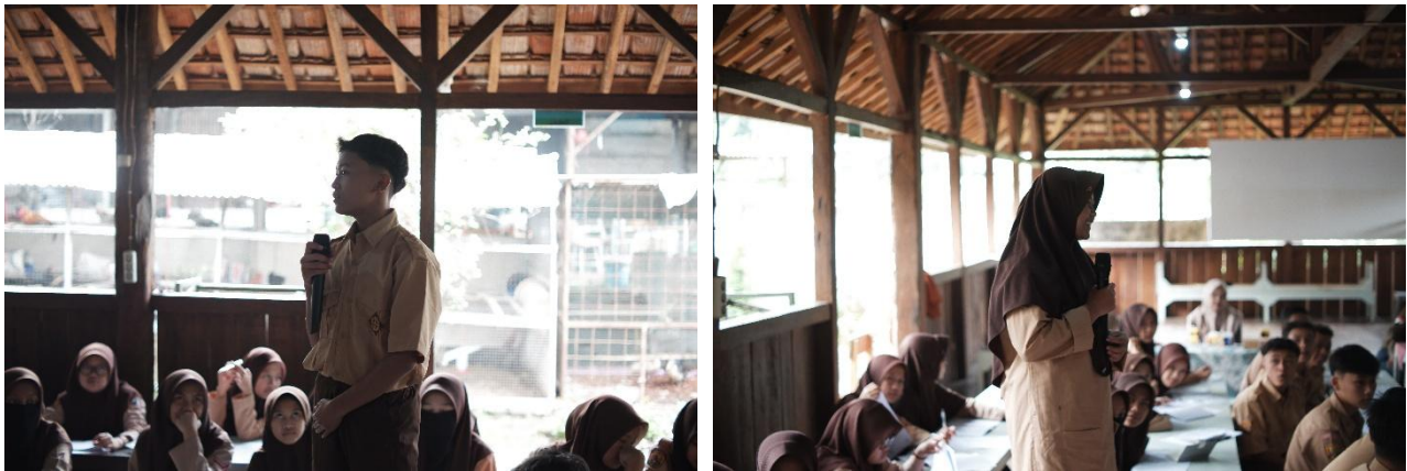
Gambar 4. Proses siswa menjawab pertanyaan kuis

dilakukan. Hal ini dapat terlihat dari keaktifan siswa saat memberikan jawaban atas pertanyaan yang dilontarkan oleh tim yang sudah disiapkan sebelumnya.