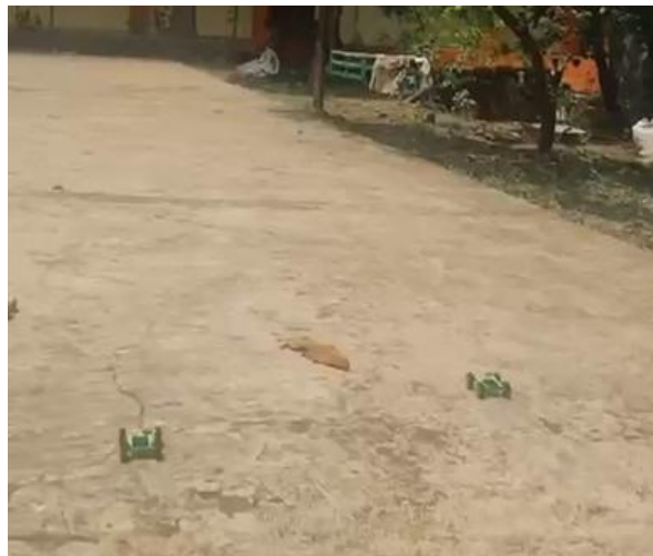
Gambar 3. Proses pengetesan pergerakan mobil

Setelah para siswa selesai merakit mobil mainan bertenaga surya, siswa kemudian mencoba menjalankan mobil mainan yang telah dirakit tersebut. Dikarenakan mobil mainan ini menggunakan solar panel yang diletakkan di bagian atas mobil. Panel ini menyerap cahaya matahari, yang mana ketika cahaya mengenai panel, elektron dalam bahan semikonduktor bergerak. Pergerakan elektron kemudian akan menghasilkan arus listrik. Listrik yang dihasilkan dari panel langsung masuk ke motor DC kecil (dinamo). Motor ini akan berputar dan mengubah energi listrik menjadi energi gerak. Motor tersebut dihubungkan ke roda (gear), dimana saat motor berputar, roda akan ikut berputar, sehingga mobil bergerak maju.