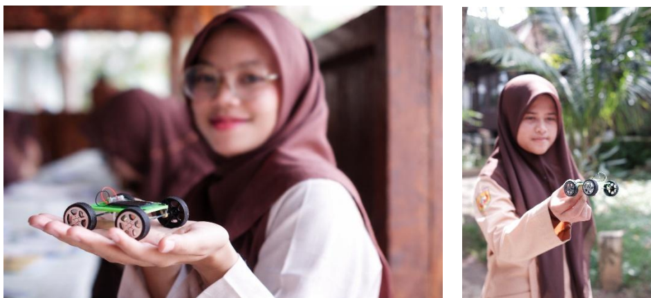
Gambar 6. Beberapa mobil yang telah selesai dirakit

Setelah perakitan mobil selesai dilakukan, mobil mainan tersebut kemudian diujicobakan dalam kondisi mendapatkan cahaya matahari sehingga dapat diketahui apakah mobil mainan tersebut berjalan dengan baik atau tidak. Dari jumlah 29 mobil mainan yang dirakit terdapat 22 mobil mainan yang telah selesai dirakit atau sekitar 75% yang kemudian diujicobakan. Hal ini terjadi karena komponen pada mobil mainan yang kecil sehingga perlu ketelitian yang cukup tinggi, yang mana belum sesuai dengan waktu pengerjaan perakitan.